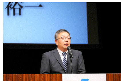
玉川青連協会長式辞