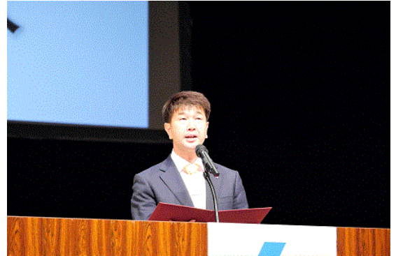
大会宣言 朴大会実行委員長

この高い志は、全国441単位会で租税教育活動がほぼ達成された現状において、より一層の推進を図るための原動力となり、更に税の「使い途」について提言をしているところであります。