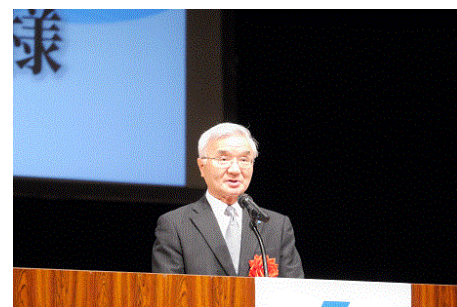
道法連中井会長祝辞