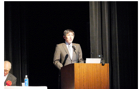
鹿屋肝属法人会(熊本県連) 租税教育活動事例発表

・「税金の大切さ」をテーマにしたヒーローショーを編集したDVDを作成し、48校に配付。