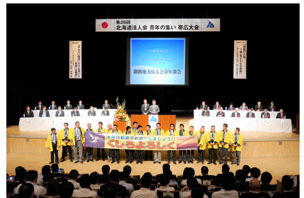
次回開催地挨拶 釧路地方法人会青年部会